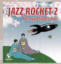
5thアルバム JAZZ ROCKET2 (bass:坂井あつひろ)