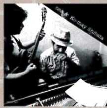
4thアルバム the language of jazz (g:nea)